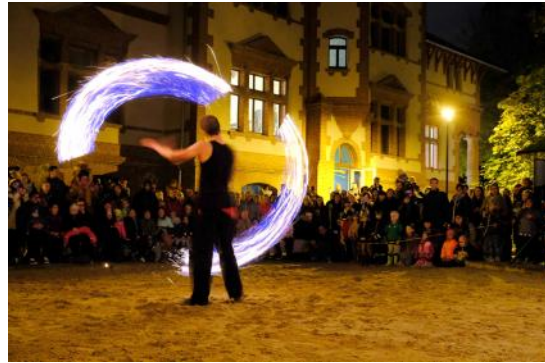
Das Herbstfeuerfest war wieder ein Höhepunkt und der Abschluss der Kultursaison