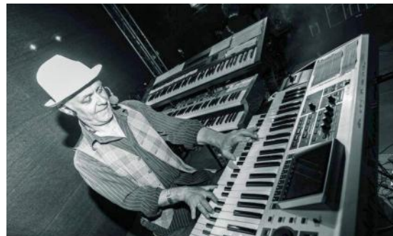
Am 06.06. haben wir mit LUNATIC eine tolle Pink Floyd-Tributband am Start. Am 26.05. kommen second|STRAITS* (Dire Straits Tribut)