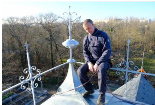
Mit einem Zierzaun auf dem Walmdach findet die Dachsanierung im März 2021 ihren Abschluss