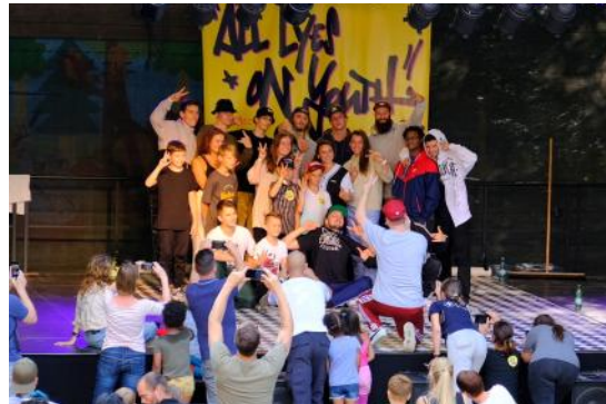
Mit "All Eyes on Youth" ist die Hip-Hop-Kultur im Juli am Peißnitzhaus zu Gast.