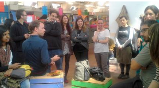
Rom 2016: Auch international sind wir unterwegs um zu lernen und uns zu vernetzen

Seit letztem Jahr vernetzen wir uns mit anderen Orten in Halle in der IG gemeinwohl-orientiertes Bauen und der IG freie Musikveranstaltende. Wir teilen Wissen und planen gemeinsame Veranstaltungen. Mehr unter fb.me/musikveranstaltendehalle und auf Instagram @musikveranstaltendehalle .