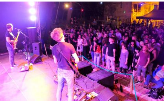
Am 04.06. starten wir 15 Uhr in den 3. Kinderliedersommer. 19 Uhr spielen dann Blue Rising Sun (Foto vom Auftritt 2019)