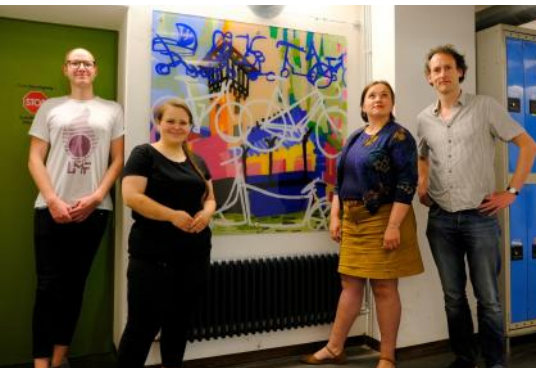
"Verpasste Zeit" gemalt von Anja Nürnberg - unser erstes Kunstwerk am Bau im Untergeschoss wurde im Juli übergeben