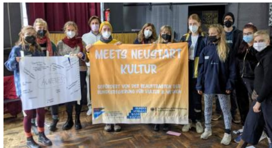
Halle 2021: ein Workshop zu Awareness des Netzwerkes freie Musikveranstaltende