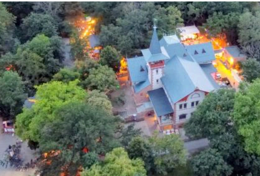
Eine Luftaufnahme bei der "Luft nach Oben" Party im August von esmero.de